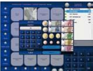
Barrechnung / Wechselgeld