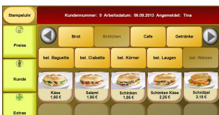
Artikelbild Ihrer Backwaren